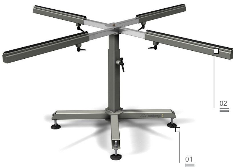
Table pour l'assemblage des garnitures

La mise au point d'un flux correct des matériels, qu'il s'agisse de produits semi-finis, de composants en cours de montage ou de produits finis, revêt une importance primordiale dans le processus de rationalisation et d'optimisation du cycle de production. La ligne Logistique d'Emmegi offre aux entreprises une réponse concrète à toutes les exigences de stockage, de manutention et d'assemblage.