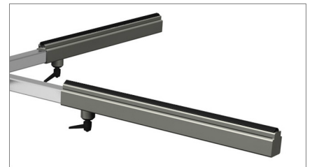
Arbeitsfläche mit rutschfestem PVC überzogen 02