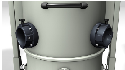
Embout d'aspiration 01