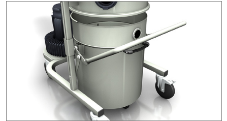
Réservoir de récupération 02