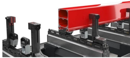
Motorisch verfahrbare Spanneinrichtungen 01